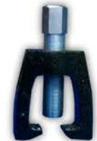
Extrator de Extremo Dirección. Universal.