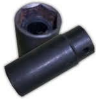
Tubo Para Bujia Universal Con Pasador.