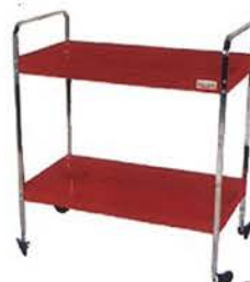
Mesa Rodante 2 Bandejas