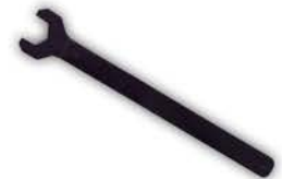
Llave para Sacar Tuerca Viscosa.