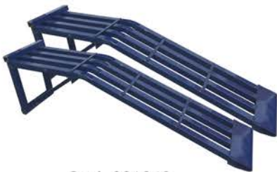
Juego de Rampas para Automotor y 4 x 4