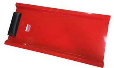
Camilla de Chapa con Ruedas