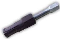
Extractor Ruleman de Diercta M. Benz.