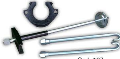
Comprimidor de Espirales Renault 12.