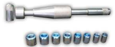
Centrador Embriague Universal.