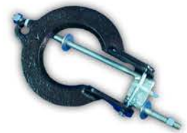
Soporte Desmontaje Amortiguador Renault 12.