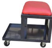
Banquito para Mecanico