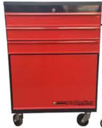
Mesa Rodante 3 Cajones y Tapa