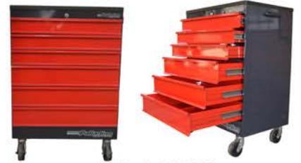
Mesa Rodante 6 Cajones