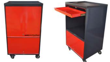
Mesa para Computadora