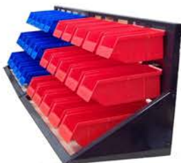
Ordenador con 15 Cajones Plasticos