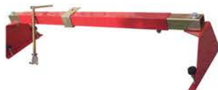
Soporte de Motor.