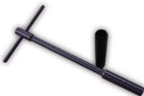
Cod. 506 T