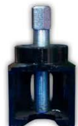
Extractor Brazo Pitman. Universal.