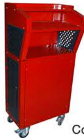
Mesa para Computadora Desarmable