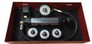
Probador de Perdida del sistema de Enfriamiento