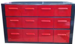
Ordenador de 12 Cajones