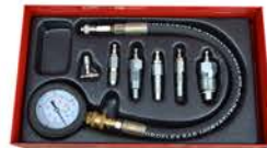
Compresometro para Diesel