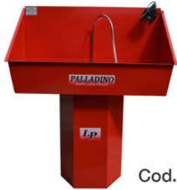
Batea Lavapiezas con Bomba Sumergible