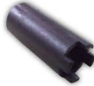
Tubo para Tuerca Inyectores tas M. Benz ohl.