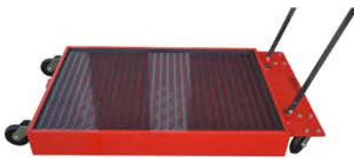
Bandeja Recolectora con Manija y Rejilla