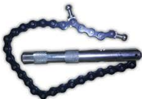
Saca Filtro de Aceite.