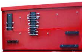
Tablero con Accesorios 2,00 mts.