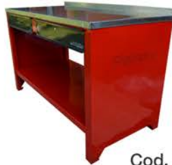
Banco de Trabajo con 2 Cajones