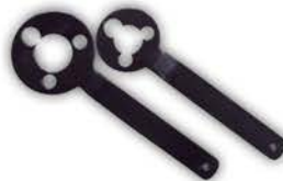
Juego de Llaves para Bomba de Agua.