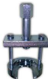
Extractor Brazo Pitman. Chevrolet y Dodge.