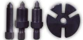
Extractor de Plato de Embrague Aire a Condicionado.