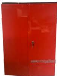
Tablero Portaherramientas con Puertas