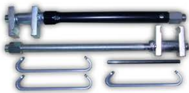
Comprimidor de Espirales Universal