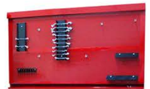
Tablero con Accesorios 1,40 mts.