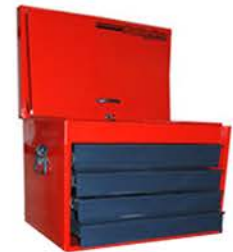
Cajonera Portaherramientas 4 Cajones