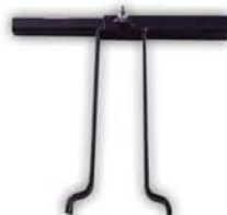
Llave para Extraer Tuerca de Tanque de Nafta.