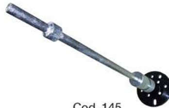
Extractor Ruleman y Ruedas Pick Up.