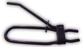
Pinza para Estrangular.