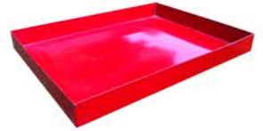
Bandeja Recolectora de Liquidos