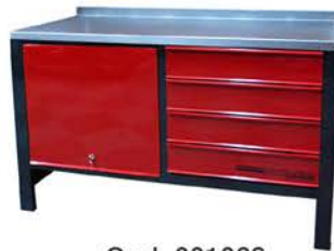
Banco de Trabajo con 4 Cajones y Puerta