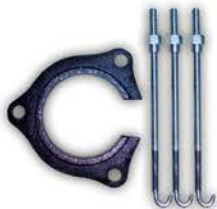
Comprimidor de Espirales Renault 18.