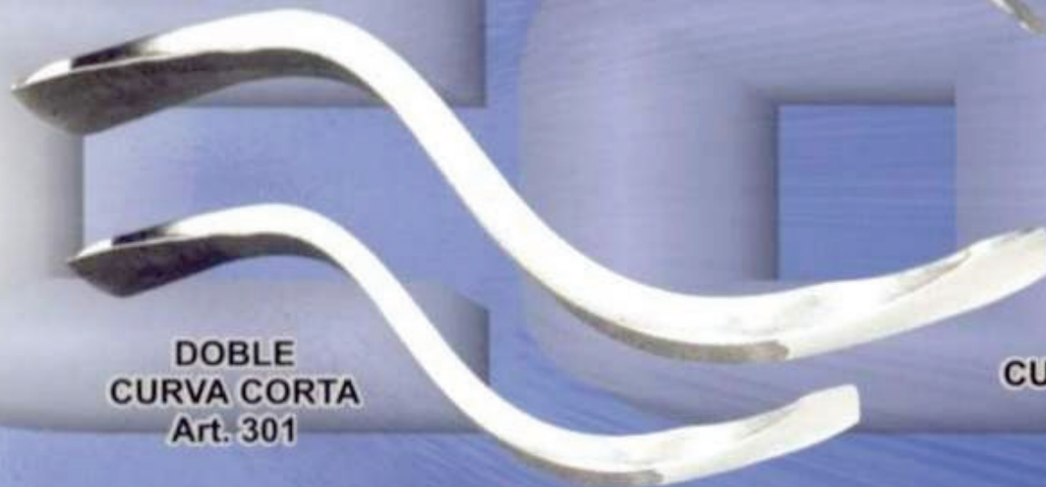
DOBLE CURVA CORTA Art. 301