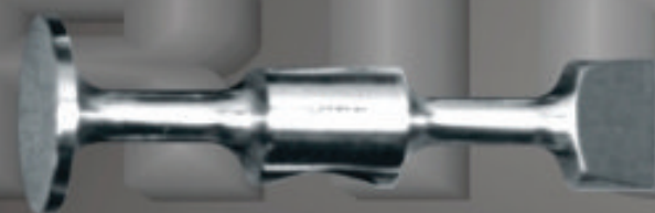
LIVIANO Art. 103