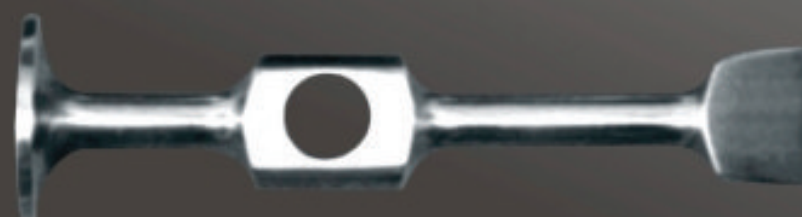
LARGO Art. 110