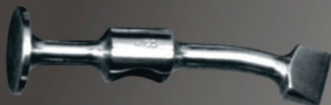
CIGÜEÑA Art. 113