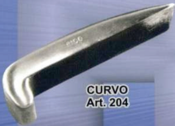
CURVO Art. 204