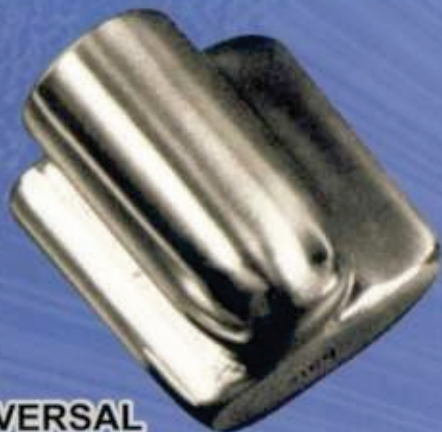
UNIVERSAL Art. 201