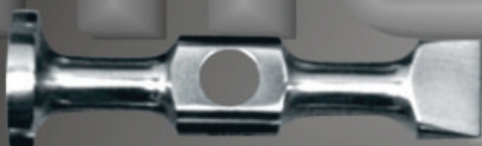
PESADO Art. 102