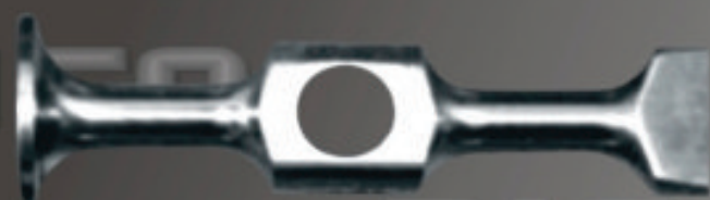
LIVIANO Art. 101