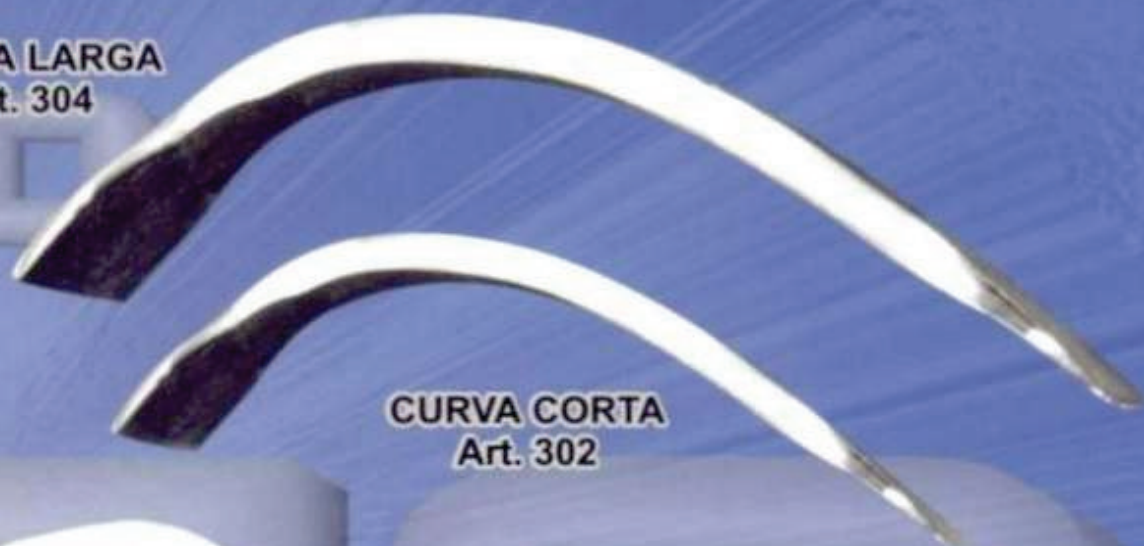
CURVA CORTA Art. 302