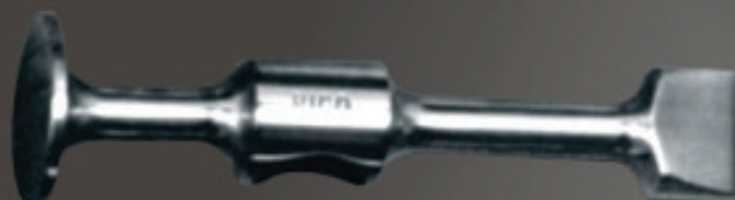
LARGO Art. 111