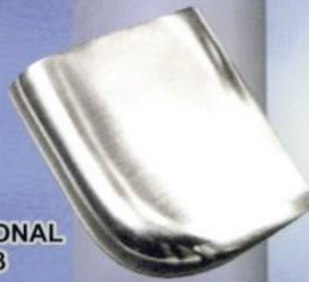
CONVENCIONAL Art. 203