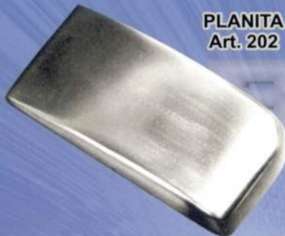
PLANITA Art. 202