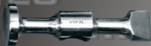
PESADO Art. 104