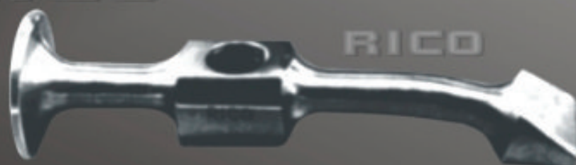
CIGÜEÑA Art. 112