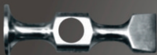
EXTRA CORTO Art. 116