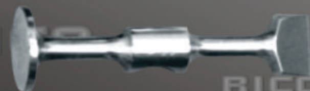
SUPER LIVIANO Art. 121