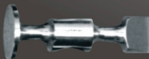
EXTRA CORTO Art. 117