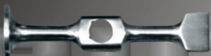
SUPER LIVIANO Art. 120